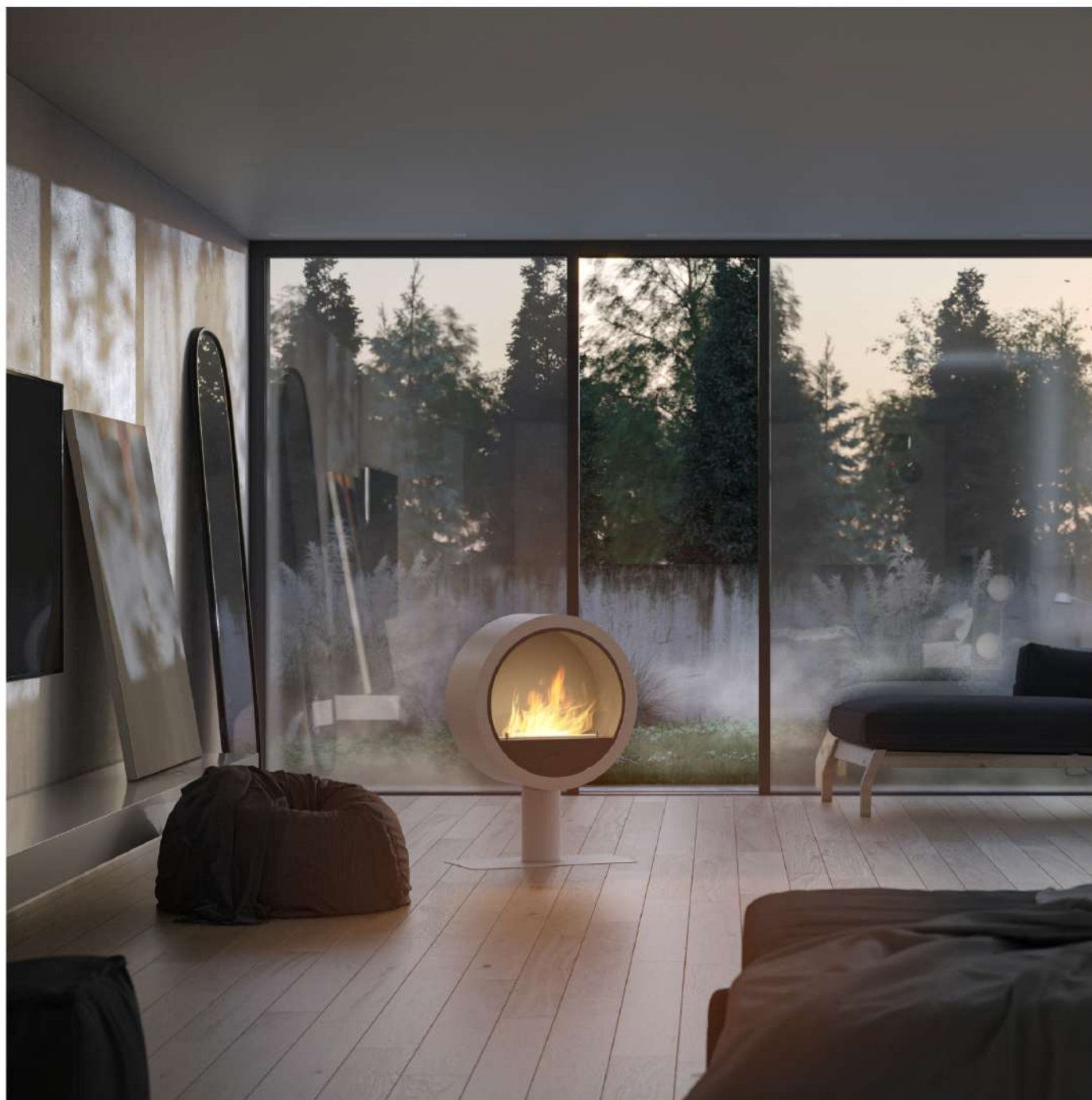
Biokominek Incyclle Stand